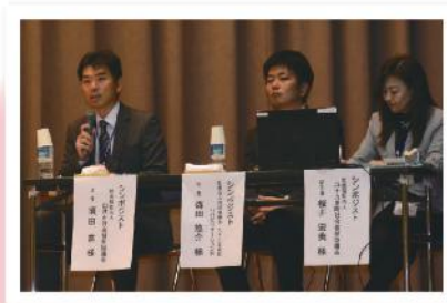
シンポジストの皆さん