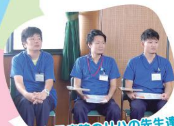
九十九里病院のリハの先生達

笑いがもたらす健康効果は免疫力アップにもなるし、自分自身も楽しいです。みんなが健康に過ごせれば国の介護の負担も減りこんな良い事はありません。機会があれば皆さんと一緒に体操を広めたいと思います。【片貝作田地区推進員】