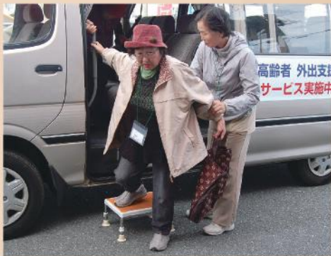
ボランティアさんに 手を添えてもらい

佐倉市社会福祉協議会でも、本会のような事業を開始したいとのことであり、視察に来ていただきました。