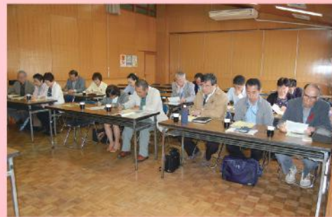
佐倉市社協の皆さん