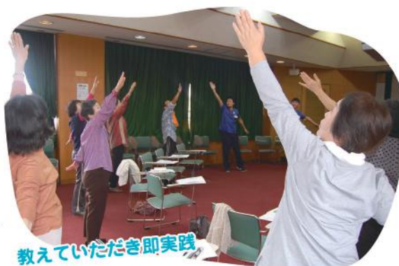
教えていただき即実践