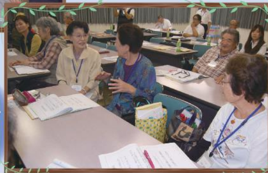
地域について話合う