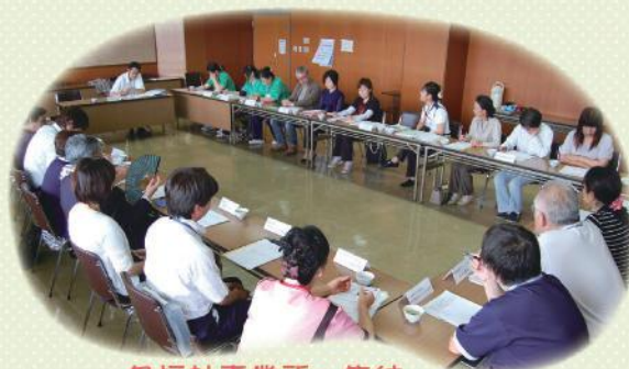
各福祉事業所、集結