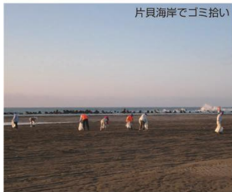
片貝海岸でゴミ拾い