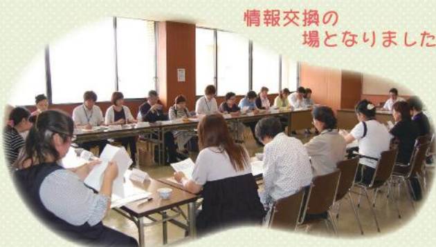
情報交換の場となりました