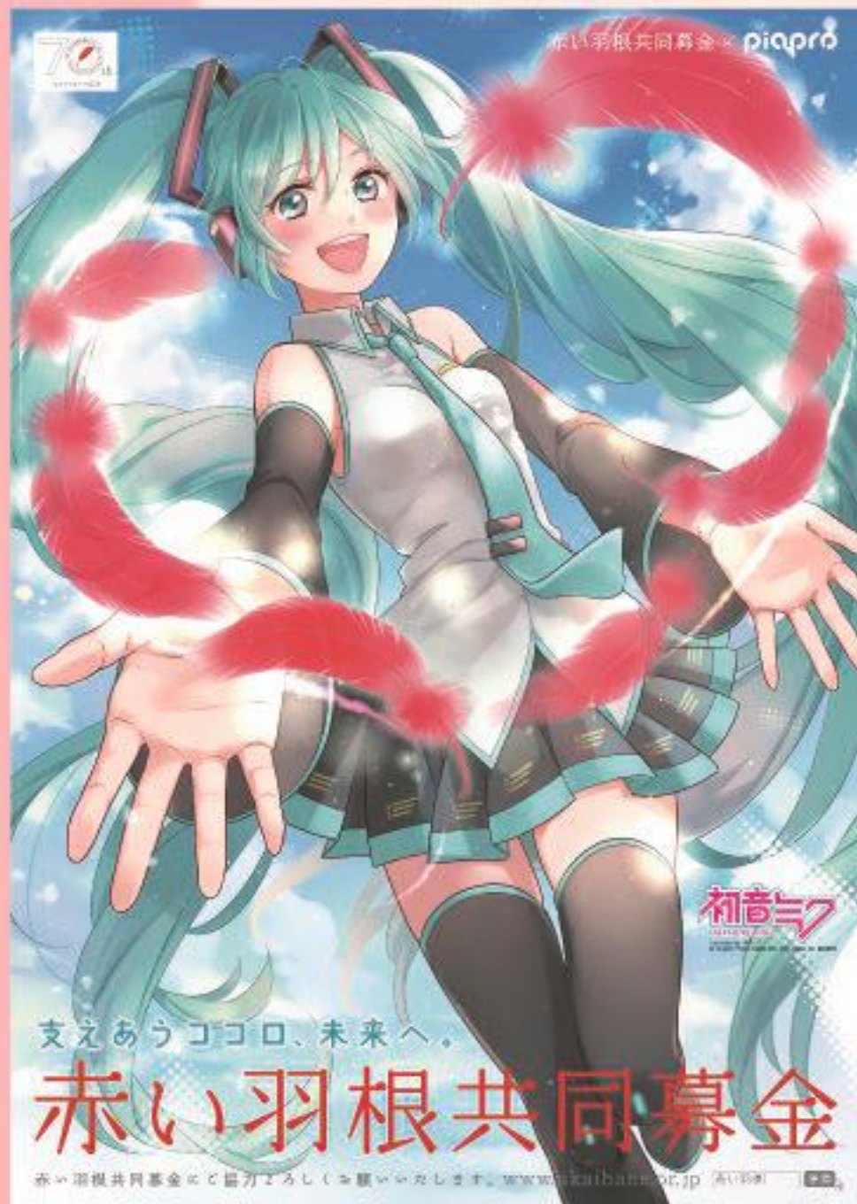
Illustration by 099cc © Crypton Future Media, INC. www.piapro.net. P10070