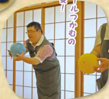
ボールつかむの大変!