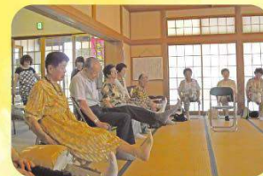
足を上げてバランスよく