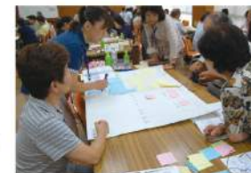
地域の良いところ考え中

講座の参加者からは「地域のよい所等を具体的に考えたこともなかったので、自分達に出来る事を考える良い機会になった。」「これを機会に地域福祉に積極的に参加したい。」「自分に出来ることを即、実行に移したい。」など、地域支援の大切さを実感することが出来た一日となりました。