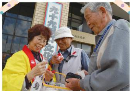
募金ありがとうございます!!