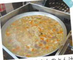
具だくさんのとん汁