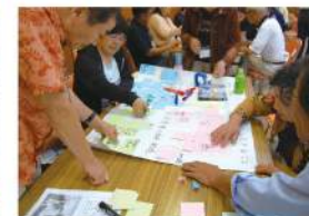
これもあれもあるね