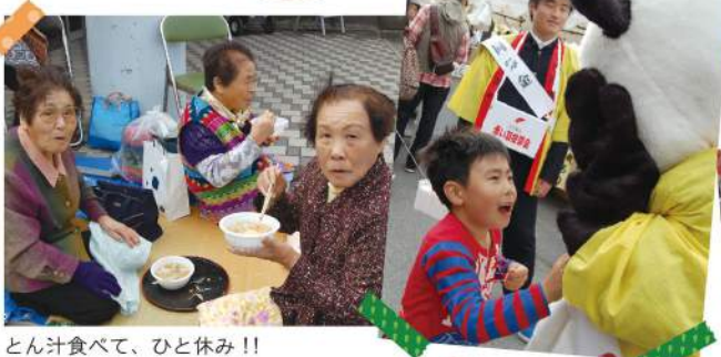
とん汁食べて、ひと休み!!