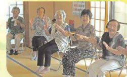
リズムに合わせて