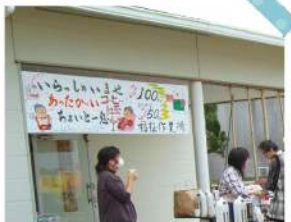
福祉作業所 カフェ