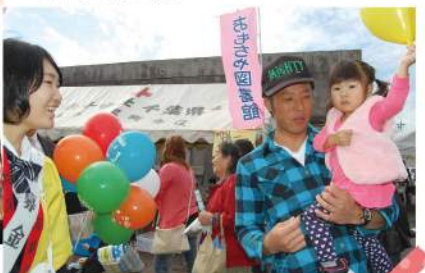
募金したので風船もらったヨ!!

あなたのハートを募金にかえて・・・ あなたのやさしさが、あなたの住む九十九里町を、 もっと優しくしてくれます。