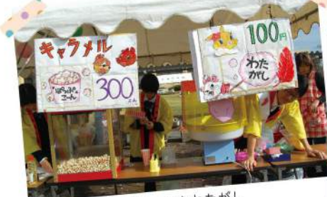
手づくりのポップコーンとわたがし