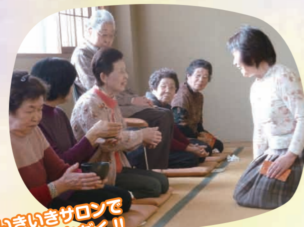
いきいきサロンでお茶をいただく!!