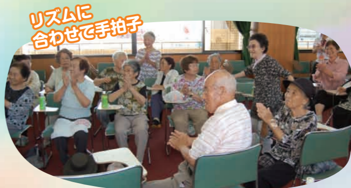
リズムに合わせて手拍子

7月12日に片貝地区社会福祉協議会のみなさんが中央公民館でふれあい七夕のサロンを開催しました。